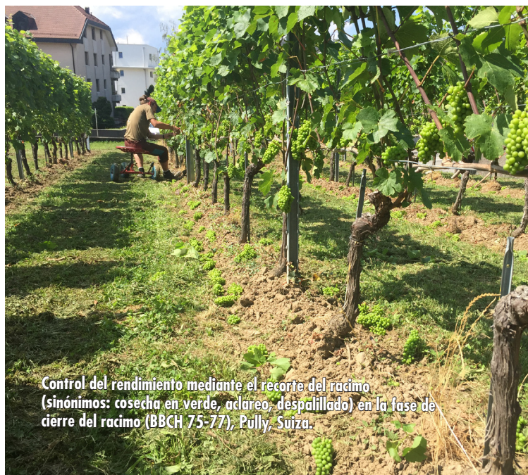
Control del rendimiento mediante el recorte del racimo (sinónimos: cosecha en verde, aclareo, despallado) en la fase de cierre del racimo (BBCH 75-77), Pully, Suiza.

La gestión integrada de la nutrición nitrogenada de la vid busca garantizar que las uvas en vendimia tengan la composición adecuada dependiendo de los objetivos de producción (rendimiento y composición). En este ensayo agronómico se estudiaron los efectos combinados de: i. la fertilización; y ii. la regulación del rendimiento mediante aclareo o vendimia en verde; sobre la acumulación de carbono y nitrógeno en las uvas. La presencia de efectos resultantes marcados sugiere que es necesario anticipar el control de la composición de la uva en vendimia durante al menos dos años consecutivos, lo que implica una rigurosa planificación a largo plazo.