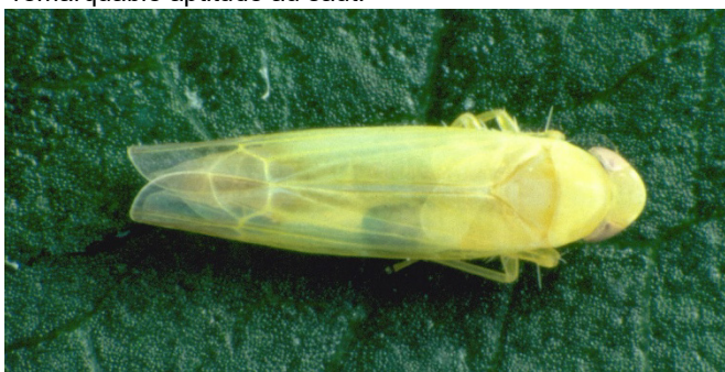
Fig. 1: Forme adulte d'une espèce typique de la famille des cicadelles.

Outre les pucerons, les cochenilles, les psylles et les punaises, on observe parfois sur les arbres fruitiers un autre groupe d'insectes suceurs de sève, celui des cicadelles. Ce groupe recouvre un grand nombre d'espèces qui se différencient par leur aspect et les dégâts qu'elles occasionnent. Elles ont en commun, au repos, de replier leurs ailes en forme de toit sur l'arrière du corps. Elles se caractérisent également par un rétrécissement du corps de l'avant vers l'arrière (fig. 1) et par une remarquable aptitude au saut.