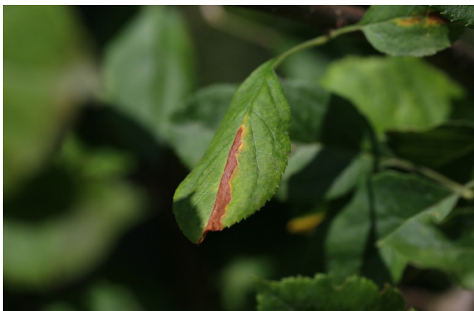
Fig. 8 a+b: Dégâts de succion caractéristiques de la cicadelle japonaise sur le feuillage.

La cicadelle bubale a besoin de deux types d'hôtes: des plantes herbacées pour le développement des larves et des adultes, et des plantes ligneuses pour la ponte. Elle hiverne sous forme d'œuf, dissimulée sous l'écorce d'essences fruitières, forestières ou de plantes d'ornement. Les larves éclosent de mi-mai à mi-juin et se laissent tomber au sol. Les cinq stades larvaires se nourrissent de diverses plantes herbacées (principalement des Fabacées et des Convolvulacées) sans leur causer de dommages importants. Les premiers adultes apparaissent vers la mi-juillet et les derniers à la mi-août. On les observe dans les vergers jusqu'à fin octobre, où ils séjournent de préférence dans la strate herbacée. La ponte a lieu de mi-août à fin octobre. La femelle choisit plutôt des rameaux d'un à trois ans, dont elle incise