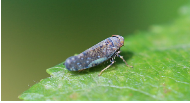
Fig. 3: Cicadelle japonaise.