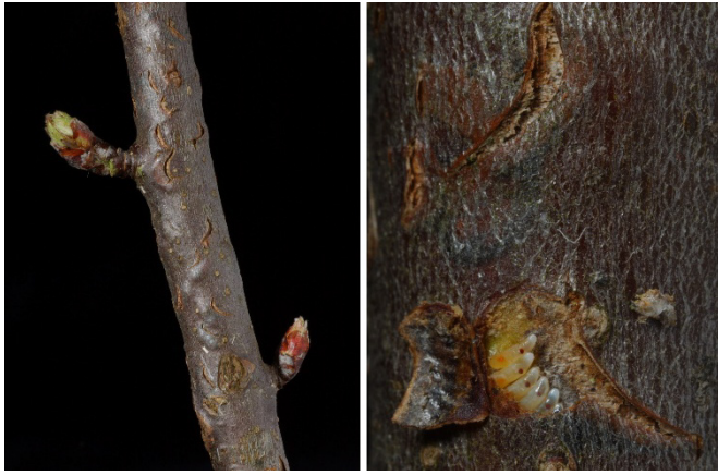
Fig. 7 a+b: Les entailles en forme d'arc pratiquées dans l'écorce par la cicadelle verte pour y pondre ses œufs peuvent également servir de portes d'entrée aux maladies.

La cicadelle verte n'occasionne généralement pas de dégâts en se nourrissant, mais pratique des entailles en forme d'arc dans l'écorce pour y déposer ses œufs, créant ainsi des portes d'entrée pour les maladies (fig. 7 a+b). La cicadelle japonaise s'est fortement répandue en quelques années et cause de plus en plus de dégâts sur le feuillage (fig. 8 a+b). Son rôle dans la propagation des maladies n'est pas clairement défini.