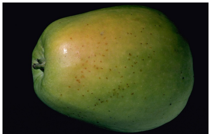
Fig. 6: Pomme souillée par des excréments de cicadelles.

Cependant, une infestation massive en fin d'été, par la deuxième génération, peut entraîner une salissure des fruits par les excréments (fig. 6). La cicadelle du troène ne provoque pas de taches foliaires, mais est un vecteur non négligeable de mycoplasmes et de virus.