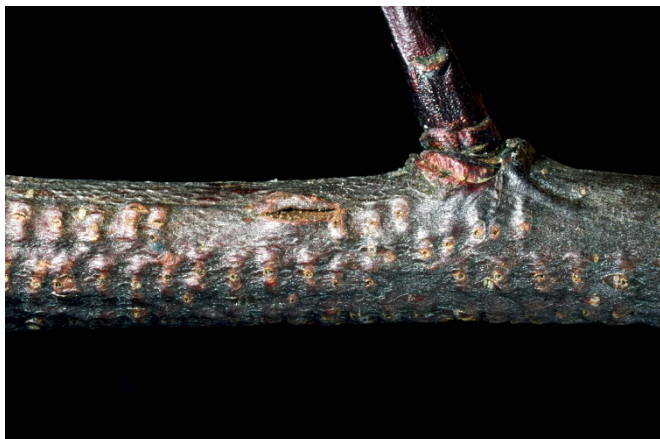
Fig. 10: Cicatrices sur une branche de pommier, résultant de la ponte de la cicadelle bubale l'année précédente.

l'écorce dans la longueur. Elle dépose ses œufs (généralement au nombre de six) de chaque côté de l'incision, à l'aide de son ovipositeur.