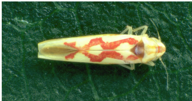
Fig. 2: Cicadelle striée.

Les antagonistes naturels des cicadelles sont notamment les larves de chrysopes, les punaises prédatrices, les parasitoïdes, les carabes, les coccinelles, les araignées et les oiseaux.