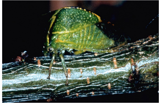
Fig. 9: Cicadelle bubale adulte.

La famille des Membracidae est observée dans le monde entier, mais en Europe, on ne dénombre qu'un petit nombre