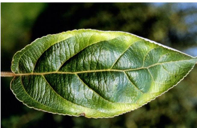
Fig. 4: Les Cicadellidae se nourrissant de phloème provoquent une décoloration du bord des feuilles.

Les dégâts varient en fonction du mode d'alimentation des cicadelles. La cicadelle verte de la vigne perce les vaisseaux du phloème sur la face inférieure des feuilles et les colmate avec sa salive. Les nervures des feuilles, observées en transparence, apparaissent sombres autour du point de piqûre, tandis que les bords de la feuille vont en s'éclaircissant (fig. 4). Le tissu foliaire se décolore à la pointe des feuilles et peut dépérir en cas d'infestation massive.