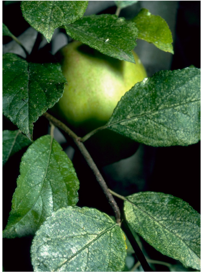
Fig. 5: Les Cicadellidae se nourrissant de parenchyme entraînent l'apparition de taches blanches sur les feuilles.

La cicadelle du rosier, la cicadelle striée et les cicadelles des arbres fruitiers se nourrissent du parenchyme. Elles atteignent le tissu foliaire en perçant la face inférieure des feuilles, dissolvent avec leur salive le contenu des cellules avoisinantes et les vident. La face supérieure des feuilles présente des taches de succion blanchâtres typiques (fig. 5), alors que les vaisseaux demeurent intacts. Bien que les cicadelles réduisent ainsi la surface d'assimilation des feuilles, les dégâts à la plante hôte sont généralement insignifiants.