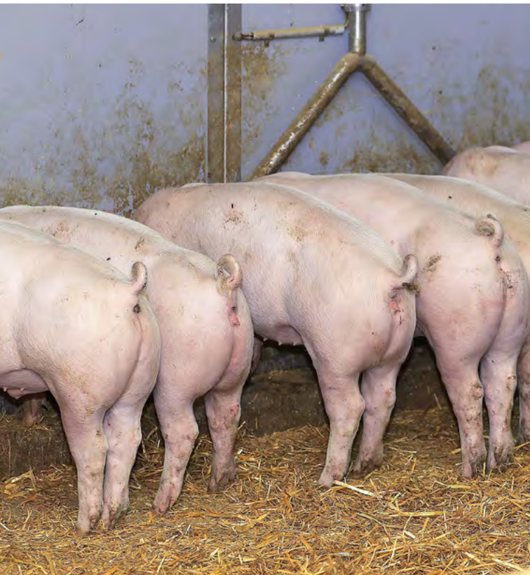
Phasenfütterung bedingt homogene Gruppen.

Auskünfte: Peter Spring, E-Mail: peter.spring@bfh.ch https://doi.org/10.34776/afs17-150 Publikationsdatum: 24. Juni 2026