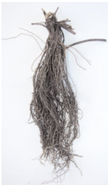
Fig. 1. Plants frigo.

1 Avec la collaboration technique de Christophe Auderset, Bernard Sauthier et Monique Benz.