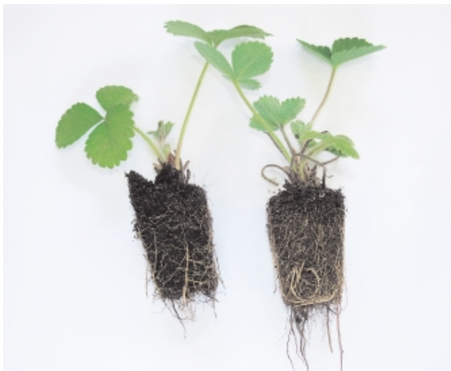
Fig. 2. Plants mottés.