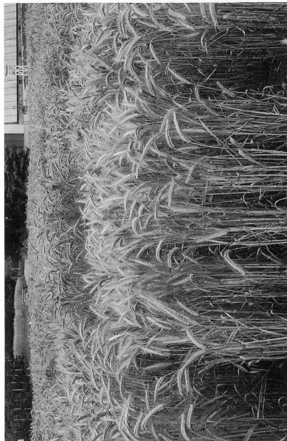
Fig. 2. La sélection pour l'obtention de triticale à paille courte est prioritaire.