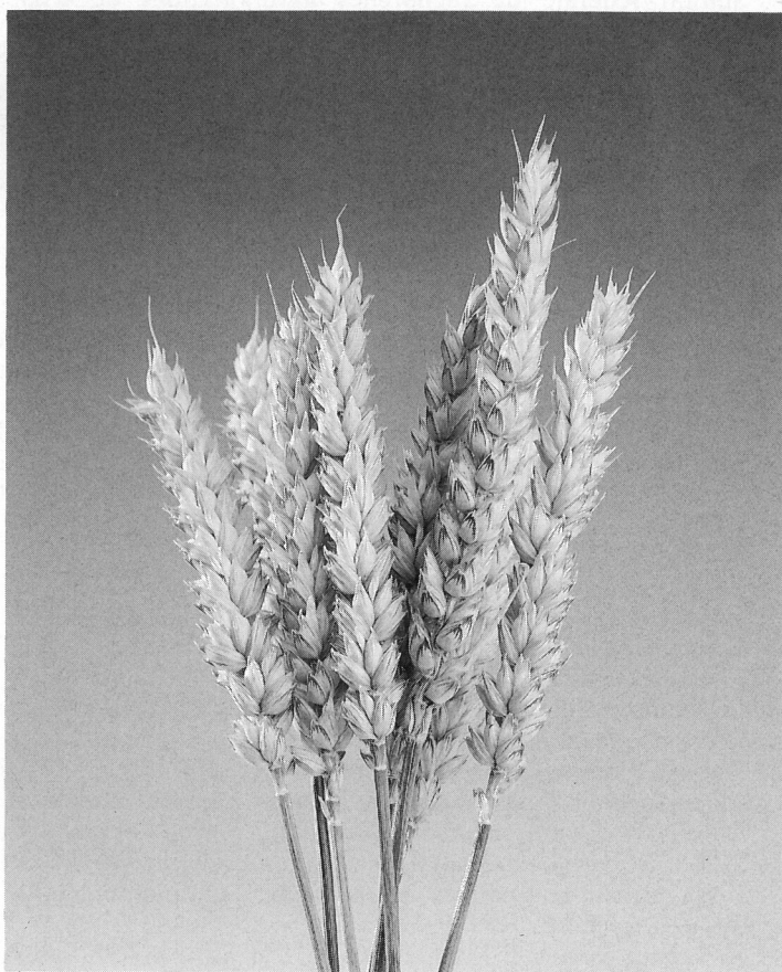
Fig. 1. Epis de la variété Obélisk.

La description des variétés présentées dans cette publication donne un aperçu de leurs caractères généraux. La