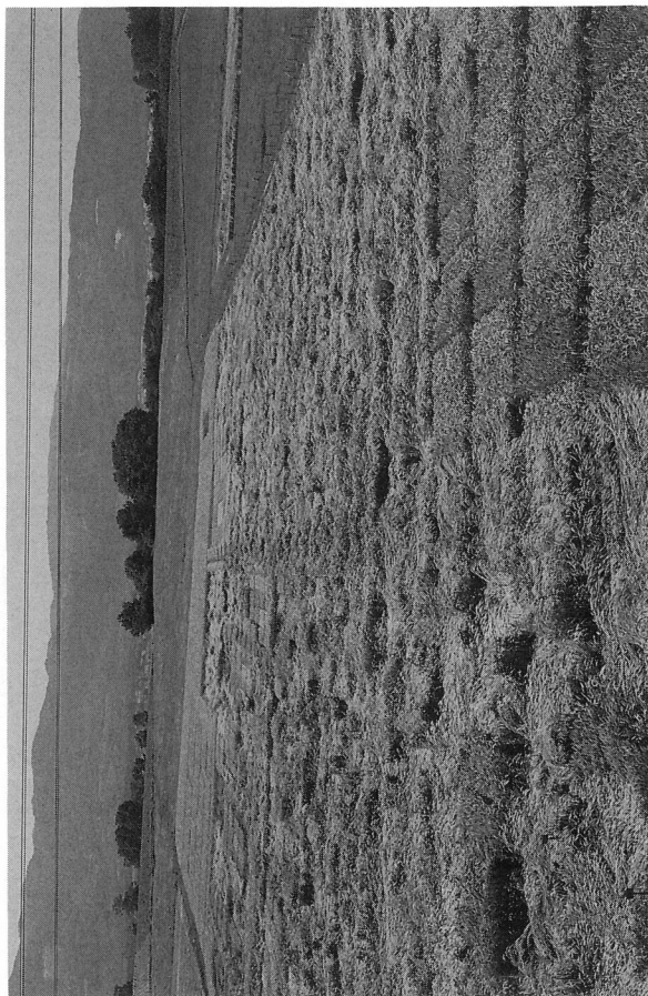
Fig. 3. A droite, au premier plan un essai de triticale à paille courte. L'excellente résistance à la verse devrait permettre de renoncer aux raccourcisseurs.