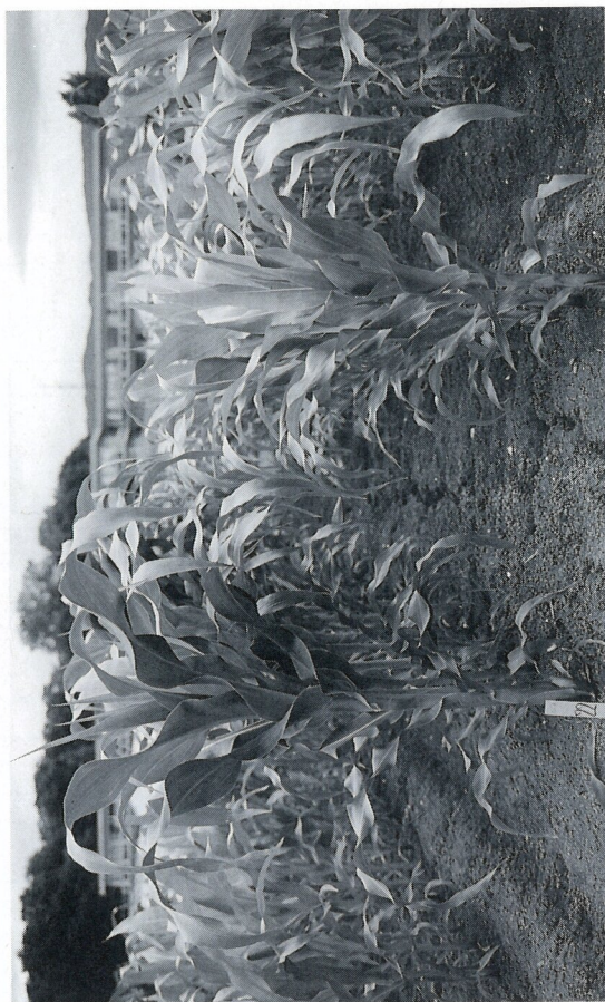
Fig. 5. Les effets négatifs d'un tassement lors de la préparation du sol pour le semis se répercutent encore lors de la montaison.