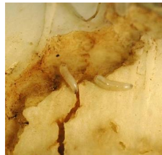
Photo 3 : Larves de la mouche du chou dans leur galerie de nourrissage sur radis long.

Les mouches du chou et de la carotte sont surveillées au moyen de pièges dans de nombreuses régions de cultures maraîchères de Suisse alémanique, ce qui permet de connaître l'activité de vol des adultes. C'est particulièrement chez les mouches des légumes qu'il importe de faire un usage ciblé (c'est-à-dire exclusivement lorsque le danger d'attaque est avéré) des rares substances actives encore autorisées.