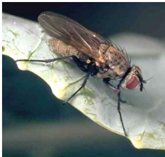
Photo 1 : Adulte de la mouche du chou

Les mouches des légumes (par exemple la mouche du chou ( Delia radicum ) et la mouche de la carotte ( Psila rosae )) font partie des ravageurs les plus difficiles à combattre en cultures maraîchères (photos 1 et 2). Leurs stades larvaires, responsables des dégâts qu'elles causent, se déroulent principalement dans le sol où ils sont difficiles à atteindre (photos 3 et 4). C'est pourquoi la lutte chimique en cours de culture vise prioritairement les mouches adultes, dans le but d'empêcher autant que possible les pontes.