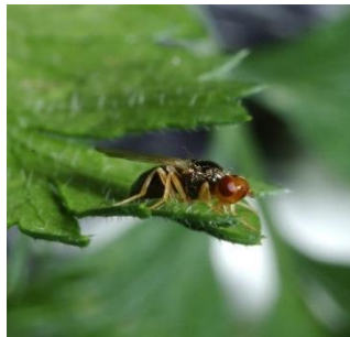
Photo 2 : Adulte de la mouche de la carotte.

Les mouches du chou et de la carotte sont surveillées au moyen de pièges dans de nombreuses régions de cultures maraîchères de Suisse alémanique, ce qui permet de connaître l'activité de vol des adultes. C'est particulièrement chez les mouches des légumes qu'il importe de faire un usage ciblé (c'est-à-dire exclusivement lorsque le danger d'attaque est avéré) des rares substances actives encore autorisées.