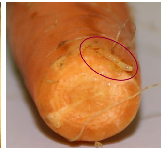
Photo 4 : Larve de la mouche de la carotte en train de forer dans une carotte.