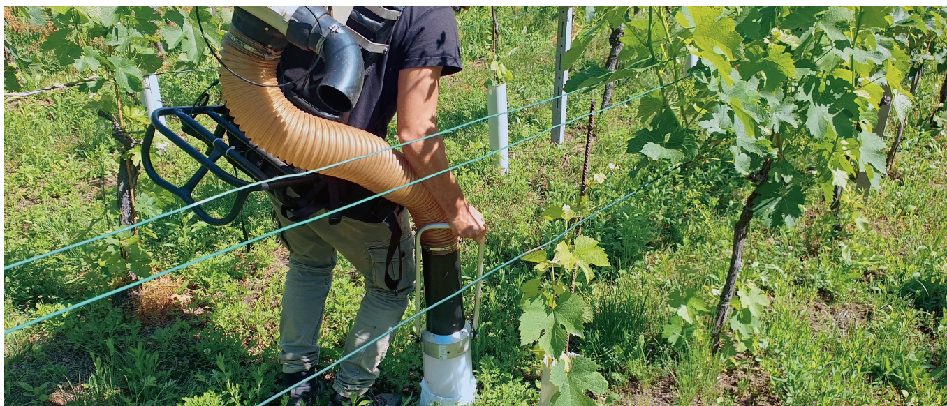
Fig. 1: Échantillonnage par aspiration dans l'interligne d'un vignoble avec un appareil D-VAC.