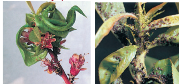
Abbildung 2: Beobachtete Symptome (Grüne Pfirsichblattläuse und Schwarze Pfirsichblattläuse).

Blattläuse ernähren sich von Pflanzensaft. Ihre Stiche schwächen die Pflanze und führen dazu, dass sich die Blätter und Endtriebe einrollen, was das Wachstum betroffener Pflanzen beeinträchtigt. Die Früchte entwickeln sich schlecht und wenn der Befall stark ist, können sie austrocknen und abfallen.