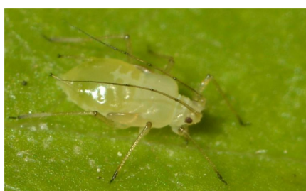
Abbildung 4: Grüne Pfirsichblattlaus ( Myzus persicae ).

Die wichtigsten Blattläuse, die auf Aprikosenbäumen auftreten, sind die Grüne Pfirsichblattlaus ( Myzus persicae ) und die Mehligelbe Pfirsich- und Pflaumenblattlaus ( Hyalopterus amygdali ). Daneben werden auch weitere Blattlaus-Arten beobachtet, wie die Schwarze Pfirsichblattlaus ( Brachycaudus persicae ) oder die Grüne Hopfenblattlaus ( Phorodon humili ).