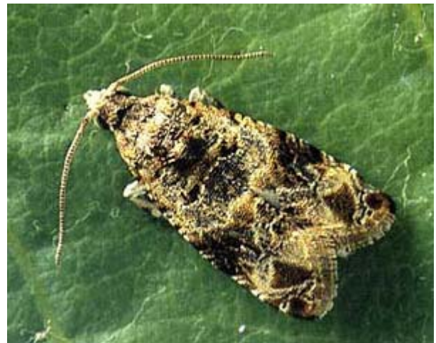
Papillon d'eudémis, Lobesia botrana . Envergure 11-13 mm.

Dans de nombreux vignobles de Suisse romande ainsi que dans quelques vignobles de Suisse alémanique, l'eudémis est présente seule ou en mélange avec la cochylys. Son importance varie d'année en année selon les conditions météorologiques. Un temps chaud et sec favorise l'augmentation des populations de l'eudémis. Les papillons, issus des chrysalides qui ont passé l'hiver dans un cocon sous l'écorce, apparaissent dans les vignes dès la mi-avril ou au début de mai. Ils sont de moeurs crépusculaires. Le vol dure 3 à 5 semaines. Après l'accouplement, les femelles de première génération pondent 40 à 60 œufs sur les capuchons floraux ou les pédoncules. Après 10 à 15 jours, les petites chenilles sortent des œufs pour pénétrer dans un bouton floral, puis confectionnent un glomérule ou nid (amas de plusieurs fleurs réunies par un tissage). La