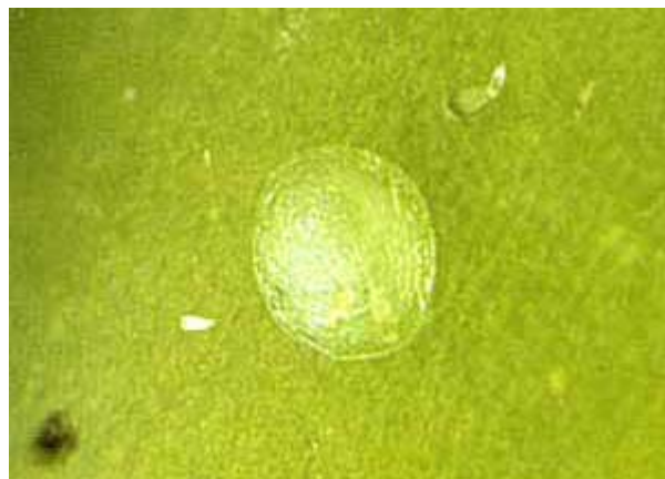
Œuf déposé sur une baie en seconde génération.

également disponibles. Plusieurs esters phosphoriques et carbamates sont aussi homologués, mais ils sont plus toxiques et plus nocifs pour la faune utile.