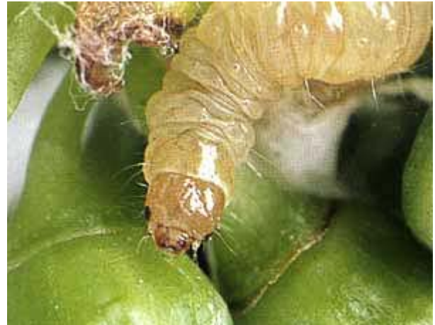
Larve d'eudémis avec son tissage en première génération.