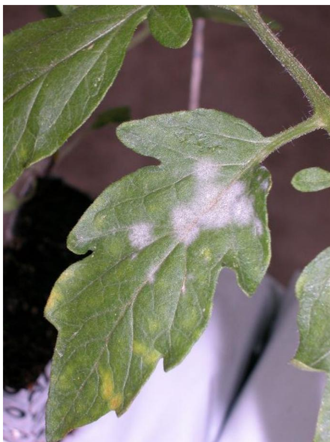
Fig. 1 : Symptômes typiques de l'oïdium sur feuille de tomate.

L'oïdium fait partie, avec le Botrytis des tiges et quelques pathogènes telluriques, des maladies les plus importantes de la tomate sous abris en Suisse. Cette fiche contient des informations utiles pour la lutte contre cette maladie qui apparaît de plus en plus fréquemment ces dernières années.