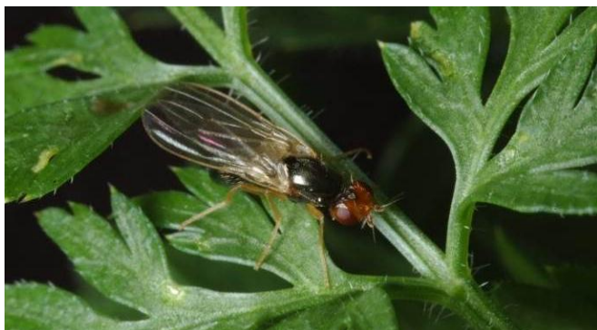
Fig. 1: Mouche de la carotte adulte sur une feuille de carotte.

En 2013, on ne disposera plus de substances actives larvicides pour la lutte contre la mouche de la carotte (fig. 1). La stratégie de lutte devra dès lors se concentrer sur les mouches adultes. Il s'ensuit que la surveillance des vols sera une condition essentielle de l'utilisation optimale des produits de traitement disponibles. À cet effet, nous présentons ici les principales caractéristiques de la biologie de ce ravageur.