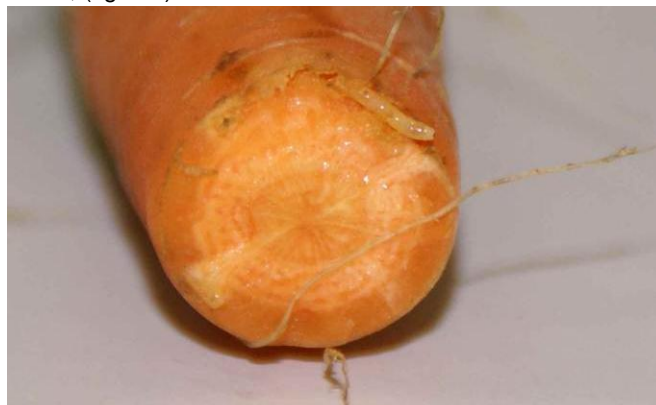
Fig. 3: Larve de la mouche de la carotte sur une carotte.

Une semaine après leur dépôt dans le sol, les oeufs éclosent et les jeunes larves commencent à se nourrir des racelles de carotte. Ce n'est qu'au troisième et dernier stade larvaire qu'elles causent les dégâts typiques, en pénétrant dans la racine principale pour y creuser les galeries de couleur brun rouille, (fig. 3-5).