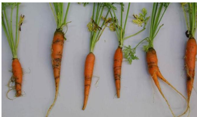
Fig. 4: Galeries de larves de mouches de la carotte, de couleur brun rouille à brun sombre, sur carottes.