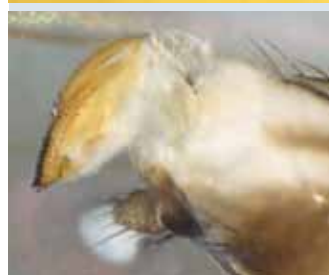
Figure 2 | Adulte femelle de D. suzukii avec son ovipositeur (ci-contre).