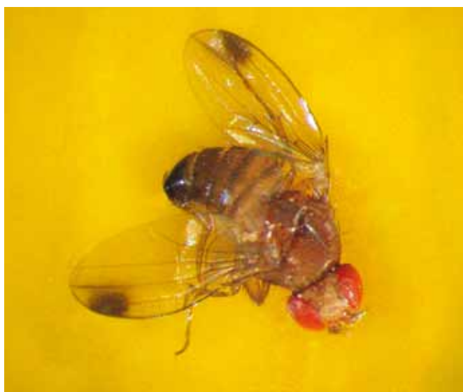
Figure 1 | Adulte mâle de D. suzukii.

drosophile du cerisier sont capables de percer l'épiderme de fruits sains d'un grand nombre de plantes hôtes (fraises, framboises, mûres, cerises, sureau, baies sauvages, etc.) ainsi que de la vigne. Ce premier dégât permet l'entrée de champignons et des bactéries, et déclenche la colonisation des baies touchées par les drosophiles communes. Le développement de la larve à l'intérieur du fruit induit une décomposition rapide de la pulpe (fig. 3). Ainsi, l'un des symptômes d'attaque parmi les plus typiques est l'affaissement des tissus sous-épidermiques des fruits infestés (blettissement). Bien que le raisin ne figure pas au menu préféré de >