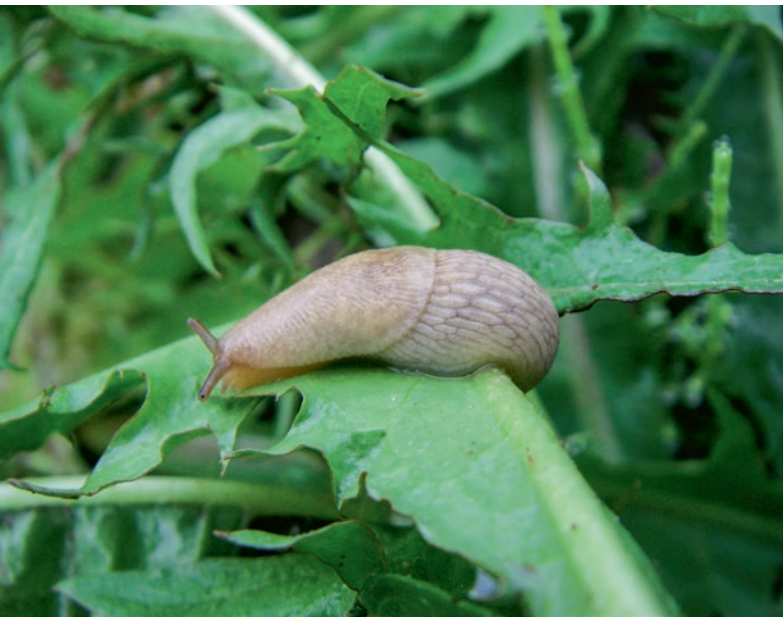
Figure 1 | Limace grise ( Deroceras reticulatum ).

Renseignements: Werner Jossi, e-mail: werner.jossi@agroscope.admin.ch