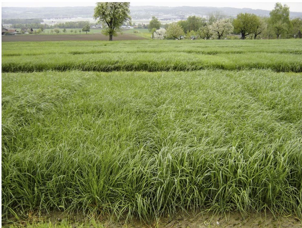
Figure 3 | Essai avec du ray-grass hybride en première repousse après l'hiver.