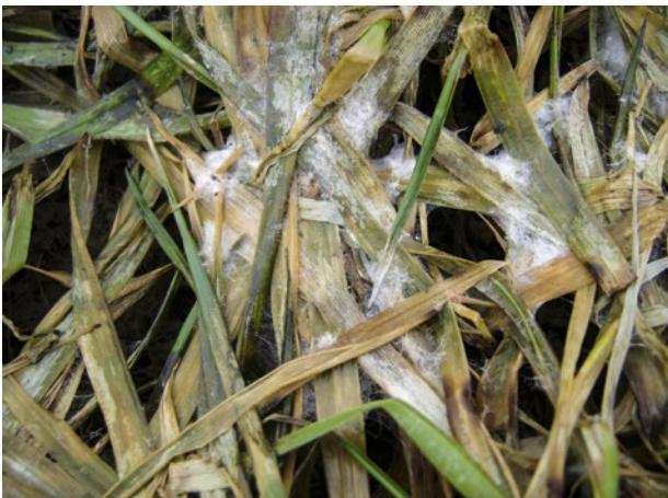
Figure 2 | La pourriture des neiges peut causer des dégâts importants dans le ray-grass hybride en sortie d'hiver.

Malgré les succès de la sélection variétale moderne, plusieurs maladies continuent à sévir. Comme les différences peuvent être considérables entre les variétés, les résistances contre les principaux agents pathogènes jouent un rôle essentiel dans l'examen des variétés. Les champignons pathogènes des rouilles comme la rouille couronnée ( Puccinia coronata ) et la rouille noire ( Puccinia graminis ) peuvent altérer le goût du fourrage et affaiblir les rendements. Il faut également citer les maladies des taches des feuilles, dues aux champignons de la famille Drechslera . Le flétrissement bactérien causé par l'agent pathogène Xanthomonas translucens pv. graminis peut exterminer les plantes et nuire gravement au peuplement végétal. Les champignons responsables de la pourriture des neiges des espèces Microdochium et Typhula peuvent causer des dégâts significatifs (Michel et al. 2013) lorsque le peuplement est recouvert d'une couche de neige pendant longtemps ou lorsque les températures oscillent entre 0 °C et 5 °C pendant plusieurs semaines et que le temps est humide (fig. 2). Le ray-grass hybride doit en général être considéré comme plus résistant à l'hiver que le ray-grass d'Italie, même s'il n'atteint pas la robustesse d'un ray-grass anglais.