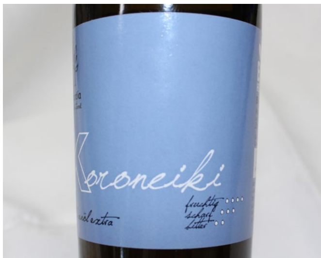
Abb. 3: Auf dem Etikett einer Olivenölfflasche erlaubter Sensory Claim.