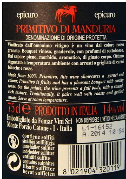
Abb. 2a und b: Beispiele von vergleichendem (a. Tomate) und nicht vergleichendem Claim (b. Wein).