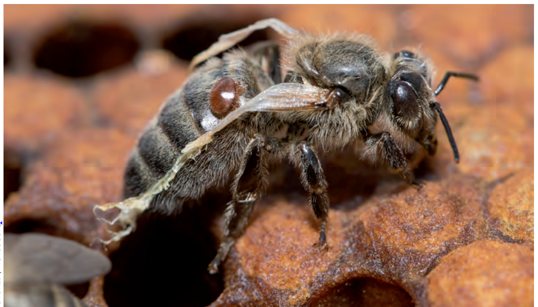
Diese Varroamilbe sitzt auf einer frisch geschlüpften Biene mit deformierten Flügeln. Als «ständiger Begleiter» setzt sich die ca. 1,7 mm grosse Varroa an ihrem Wirt fest. Beim Saugen der Hämolymphe kann die Milbe schädliche Viren übertragen.

verschiedene Initiativen zur Züchtung von Bienen mit solchen Eigenschaften. In der Schweizerischen Bienen-Zeitung wurde in letzter Zeit verschiedentlich darüber berichtet. Auch das Zentrum für Bienenforschung ist auf diesem Gebiet aktiv und versucht messbare Eigenschaften und genotypische Marker zu bestimmen, welche die Züchtung varroaresistenter Bienen ermöglichen. Alle diese Ansätze, die auf ein Gleichgewicht zwischen der Biene und ihrem Parasiten abzielen, sind Teil langjähriger Arbeiten. Es wird jedoch noch einige Jahre dauern, bis diese Arbeiten erfolgreich abgeschlossen werden können. Bis eine Methode in der Praxis verfügbar sein wird, mit der sich resistente Bienen züchten lassen, sind die Imkerinnen und Imker auf geprüfte Varroabekämpfungsmethoden angewiesen. In diesem Rahmen gilt das Interesse dem Lithiumchlorid. Das Zentrum für Bienenforschung wird eine Zusammenarbeit mit den deutschen Kollegen anstreben, um so rasch wie möglich eine Applikationsform für die Verwendung von Lithiumchlorid zu finden. Zum anderen haben wir eigene Projekte, die darauf abzielen,