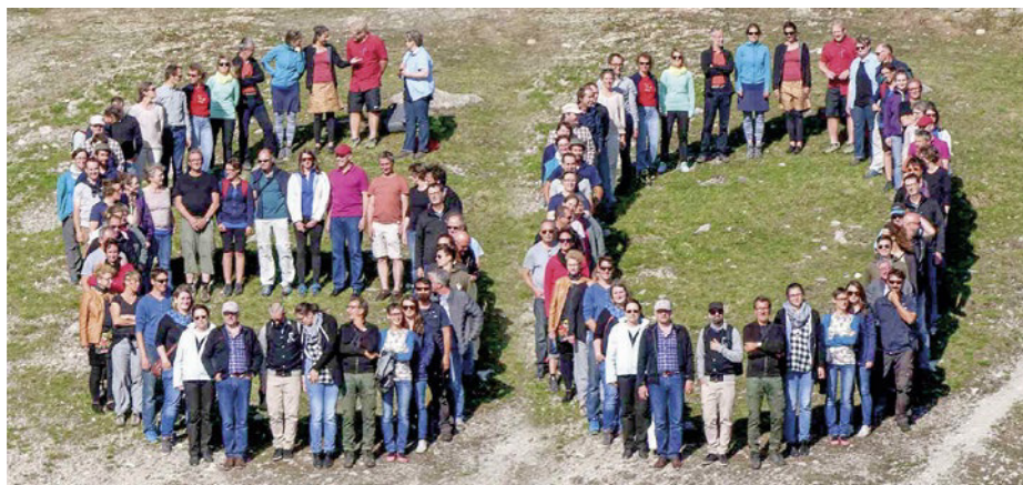
Dieses Jahr feiert die Agridea ihr 60-jähriges Jubiläum.

Am 6. Juni 1958 wurde die Schweizerische Vereinigung zur Förderung der Betriebsberatung in der Landwirtschaft (SVBL) als Dachorganisation gegründet. Darauf folgte am 25. Juni 1958 die Eröffnung der Beratungszentrale «Service roman de vulgarisation agricole» (SRVA) in Lausanne, am 1. Oktober 1958 dann die SVBL-Zentralstelle in Küsnacht ZH (später Lindau). Zu den Gründungsmitgliedern zählten 23 Kantone, 56 Organisationen und Schulen sowie eine Vereinigung landwirtschaftlicher Beratungsgruppen. Als neue Gruppen von Mitgliedern kamen