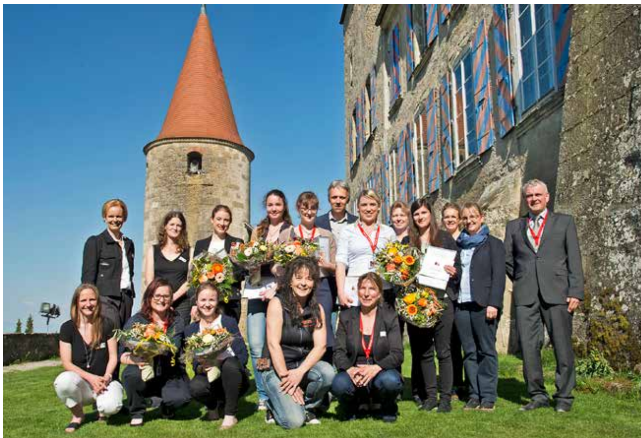
Figure 3 | Le Réseau de recherche équine suisse a récompensé les meilleures présentations et les meilleurs posters.

élevages ont fait un profit sur la vente de chevaux de trois ans après le test en terrain. Les éleveurs de la région du Jura s'en sont mieux tirés, car ils peuvent produire de manière plus rentable et bénéficier de paiements directs plus élevés en raison de la superficie des terres disponibles. En conséquence, l'étudiante a souligné l'importance de promouvoir l'image du franches-montagnes pour en augmenter le prix de vente.