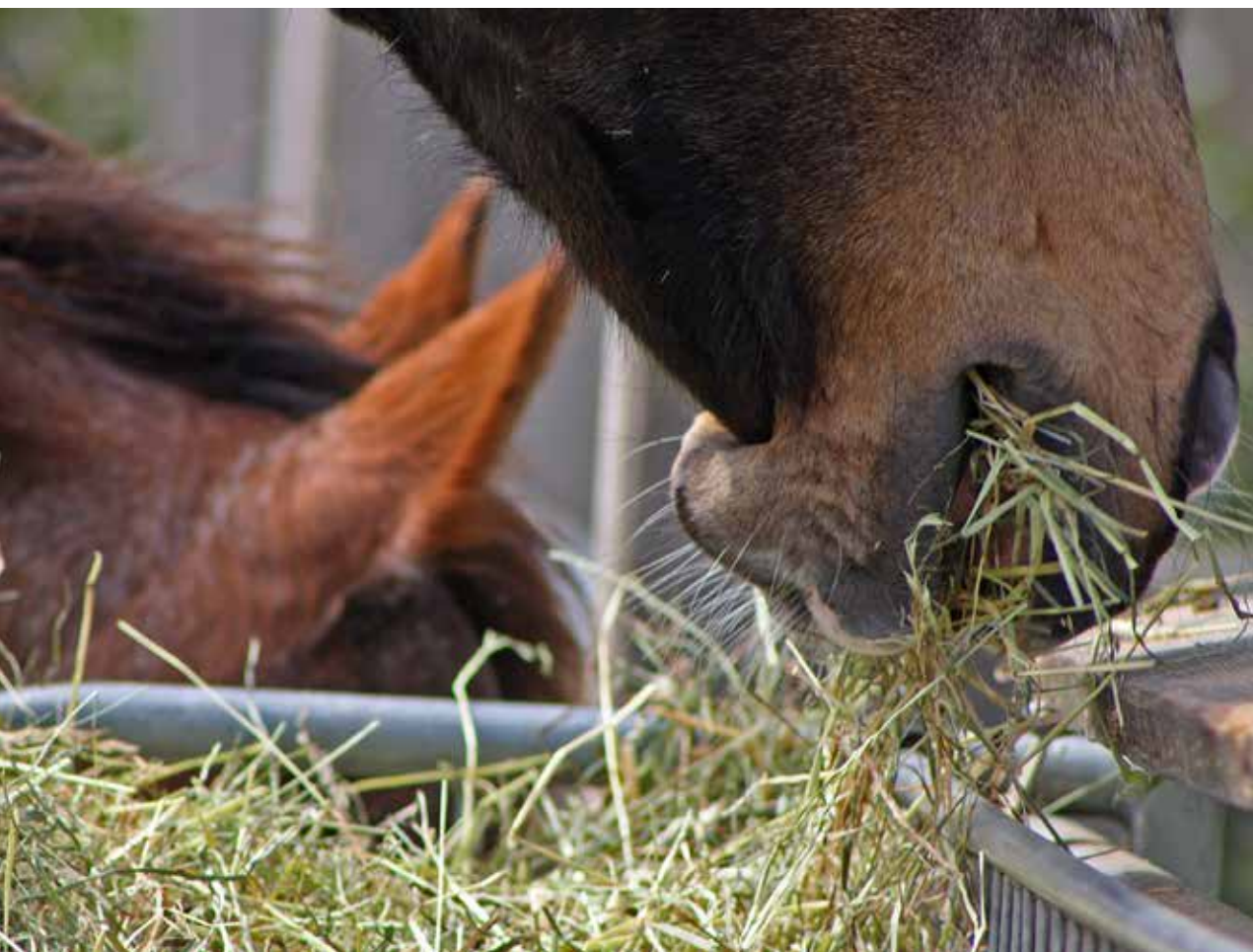
Figure 1 | Nourrir les chevaux détenus en groupe selon leurs besoins individuels est un défi.

Renseignements: Ariane Sotoudeh, e-mail: ariane.sotoudeh@agroscope.admin.ch