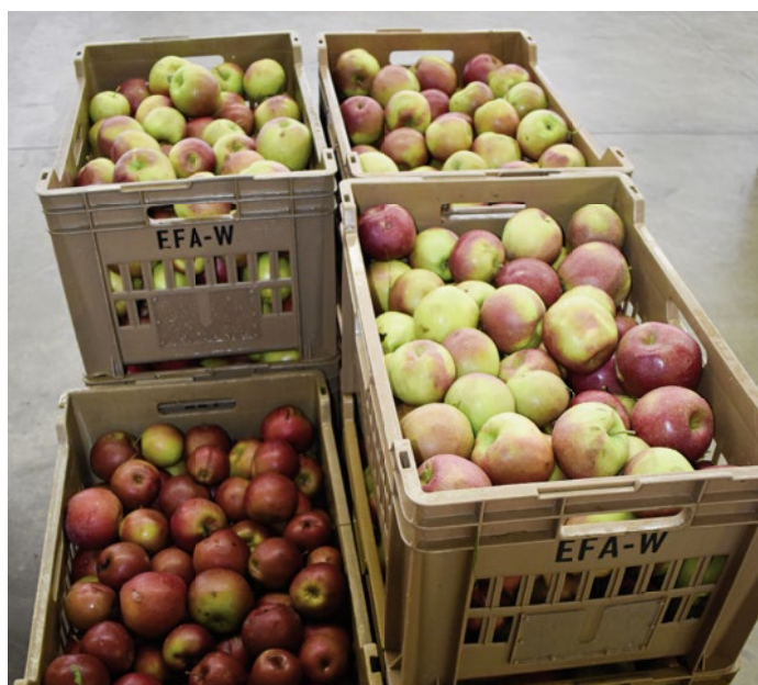
Abb. 2: Früchte von Marssonina befallenen Bäumen (vorne links) und einem gesunden Baum (restliche Kisten).

te der beiden Varianten (Tab. 3) verdeutlichen jedoch, dass dieser Unterschied nur schwer erkennbar war. Für die Variante mit Marssoninabefall konnte im Gegensatz zu einem früheren Versuch (Inderbitzin und Perren 2017) keine erhöhte Bitterkeit oder Adstringenz festgestellt werden, trotz eines um 70% erhöhten Gerbstoffgehalts (Folinwert).