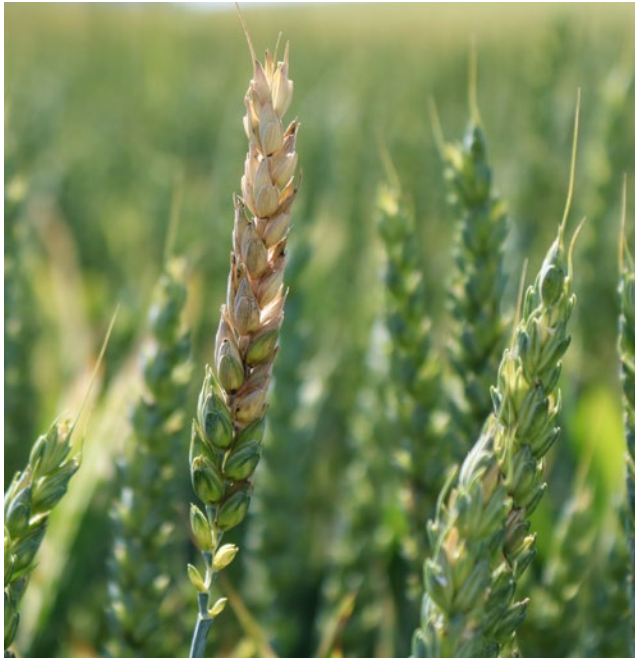
Symptômes de la fusariose des épis dans le blé.

stratégie de fertilisation dans laquelle la partie aérienne des cultures de fixation biologique de l'azote, ce qui est le cas pour des légumineuses ou des mélanges de trèfles-graminées par exemple, est récoltée et transportée vers un autre champ pour fertiliser la culture ciblée. Outre les avantages en termes de fertilisation des sols, l'approche « cut-and-carry » pourrait permettre de réduire des maladies du sol et des maladies transmises par les résidus de récolte. La biofumigation « cut-and-carry » avec de la moutarde pourrait par exemple inhiber l'inoculum de la fusariose de l'épi sur les résidus de culture et réduire le développement de la maladie dans la culture céréalière suivante.