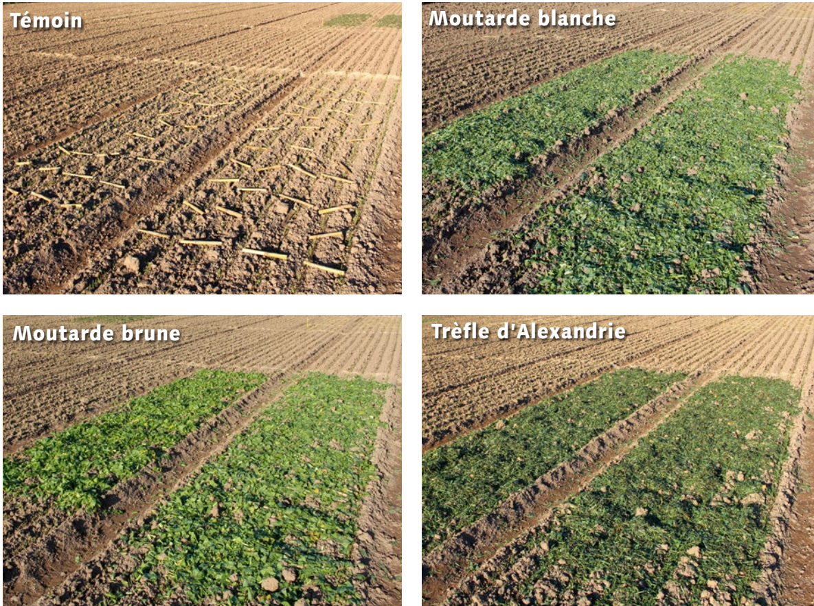
Figure 2 : Simulation d'une rotation maïs-blé et traitements expérimentaux visant à réduire la fusariose de l'épi et la contamination par les mycotoxines dans le blé. Témoin : parcelles avec des tiges de maïs infectées par le Fusarium , sans traitement; la moutarde blanche, la moutarde brune et le trèfle d'Alexandrie : parcelles avec des traitements de biofumigation « cut-and-carry » où les biomasses aériennes couvrent les tiges de maïs infectées par le Fusarium ; chaque parcelle a été divisée en deux avec deux variétés de blé différentes (Levis et Forel).

En outre, il y a une tendance à réduire l'utilisation des pesticides afin de minimiser l'impact négatif sur l'environnement et la santé humaine. Il est donc important de développer des solutions alternatives pour lutter contre les mycotoxines