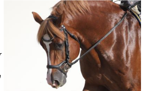
Abb.2: Beispiel einer lateralen Ohrenstellung; die Ohrmuscheln zeigen nach seitlich-unten