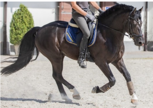
Abb.1: Beispiel einer der beobachteten Ohrenpositionen; beide Ohren sind gleichermaßen nach vorne gerichtet

Die Erkennung von Stress beim Pferd ist wichtig, um Faktoren in der Haltung oder während des Trainings, die möglicherweise das Tierwohl gefährden könnten, zu erkennen. Insbesondere für die Stressdetektion bei gerittenen Pferden werden weitere non-invasive Messmethoden benötigt. In der vorliegenden Studie wurden Ohrenstellungen und Ohrenbewegungen als mögliche ethologische Indikatoren für Stress beim gerittenen Pferd untersucht.