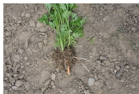
Fig. 2: L'armoise vulgaire exerce une forte concurrence dans la culture hâtée de carottes, avec menace de perte de rendement.

Les souchets comestibles ( Cyperus esculentus ) ont déjà formé leurs nouvelles bulbillles (fig. 1) en mai et assuré ainsi l'émergence d'une nouvelle génération qui se développera durant l'année. L'armoise commune ( Artemisia vulgaris ) est également en progression et peut se développer pleinement dans les conditions optimales régnant sous les bâches. De plus, les racines des armoises de l'année précédente se remettent en végétation, se développant beaucoup plus vite que les semis de carottes, dont le début de croissance est très lent (fig. 2).