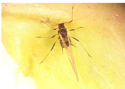
Photo 5: On observe aussi des vols d'invasion de pucerons (par exemple le puceron de la laitue Nasonovia ribisnigri ou le puceron vert du pêcher Myzus persicae ) dans les cultures de salades.