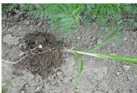
Fig. 1: Plante de souchet comestible avec une jeune bulbillle dans une culture de pommes de terre précoces sous voile, début mai.

Comme les cultures hâtées (pommes de terre précoces ou carottes), les adventices problématiques se développent très bien dans le climat régnant sous les couvertures thermiques. L'invasion par ces plantes indésirables et leur impact sur la culture ne deviennent souvent visibles qu'au moment du retrait des films et voiles de protection.