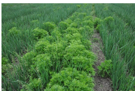
Fig. 3: Les armoises se disséminent surtout par division mécanique de leurs souches. Dans le cas illustré ici, la machine à récolter ne devrait plus être utilisée en raison de ce gros risque de propagation.

Les souchets comestibles ( Cyperus esculentus ) ont déjà formé leurs nouvelles bulbillles (fig. 1) en mai et assuré ainsi l'émergence d'une nouvelle génération qui se développera durant l'année. L'armoise commune ( Artemisia vulgaris ) est également en progression et peut se développer pleinement dans les conditions optimales régnant sous les bâches. De plus, les racines des armoises de l'année précédente se remettent en végétation, se développant beaucoup plus vite que les semis de carottes, dont le début de croissance est très lent (fig. 2).