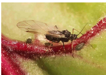
Photo 4: Lors du contrôle en champs de lundi, des attaques du puceron noir de la fève ( Aphis fabae ) sur diverses cultures d'apiacées et de chénopodiacées, par exemple les betteraves à salade, ont été relevées.