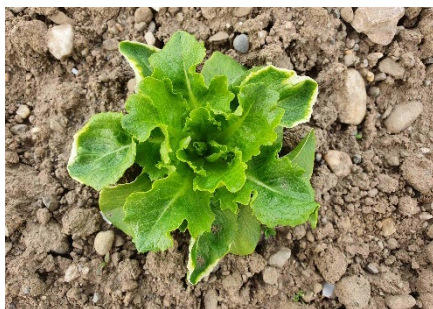
Photo 2: Les chloroses marginales des feuilles de salades sont aussi une conséquence du gel.