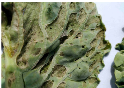
Photo 1: Ces déchirures de l'épiderme de la face inférieure des feuilles de choux frisés sont vraisemblablement une conséquence du gel tardif (photo: Suzanne Schnieper, Liebegg, Gränichen).