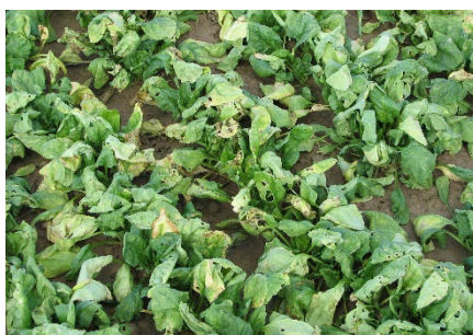
Photo 5: On a détecté la maladie des taches foliaires à Colletotrichum ( C. dermatium f. sp. spinaciae ) sur des plantes d'épinards : leurs feuilles sont jaunissantes et parsemées de taches brunes arrondies.