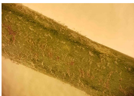
Photo 15: Duvet de sporanges du mildiou sur une fine feuille d'oignon, vu sous binoculaire.