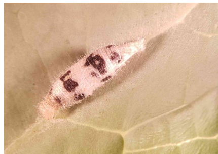
Photo 3: Dans une parcelle de choux non traités, on a découvert des larves de piérides de la rave parasitées par l'hyménoptère Hyposoter ebeninus . Cet auxiliaire s'attaque aux jeunes chenilles de stades L1 à L3.