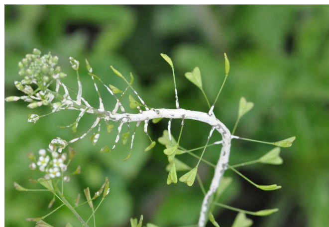
Figure 2: Parmi les pathogènes de la capselle-bourse-à-pasteur ( Capsella bursa-pastoris ) figure la rouille blanche des brassicacées ( Albugo candida ).

René Total (Agroscope) rene.total@agroscope.admin.ch