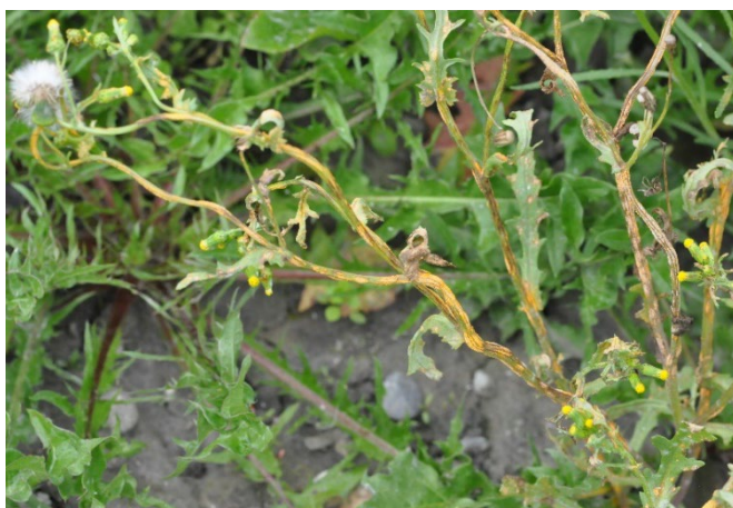
Figure 1: Sporangies de couleur orange de la rouille Puccinia lagenophorae sur les tiges d'un séneçon commun ( Senecio vulgaris ).

De nombreux pathogènes peuvent donc se multiplier sur des adventices et, pour certains, infecter ensuite les plantes cultivées et y causer des dégâts. C'est pourquoi il convient d'attacher une grande importance à la lutte contre les adventices et à l'hygiène au champ dans l'optique d'une protection préventive et durable des cultures.