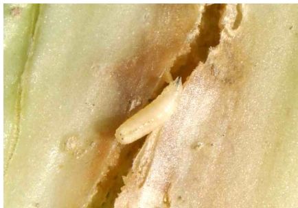
Photo 1: On observe toujours un vol extrêmement soutenu de la mouche du chou ( Delia radicum ) dans quelques sites, en particulier en Suisse orientale. Il convient de protéger les cultures sensibles.