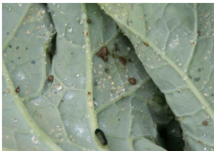
Photo 10: Pupes matures de mouches blanches du chou sur des feuilles de chou frisés laissées au champ après parage (photo du 20.09.2021).