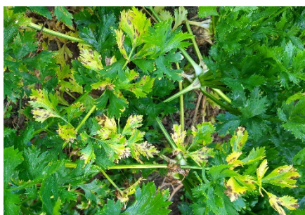
Photo 4: Les atteintes de septoriose (causée par S. apiicola ) sur céleris sont encore en augmentation dans de nombreuses régions de production.