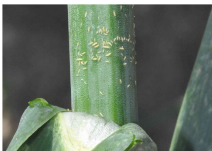
Photo 8: Dans plusieurs régions de culture, le vol automnal massif de thrips ( Thrips tabaci entre autres) poursuit son cours. Par endroits, le pic des attaques de l'année n'est atteint que maintenant dans les cultures de liliacées. Il est recommandé de contrôler les cultures.