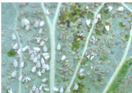
Photo 11: Adultes de la mouche blanche du chou venant d'émerger de leurs pupes il y a une semaine à peine, dans une culture de chou de Bruxelles, (photo: Agroscope).