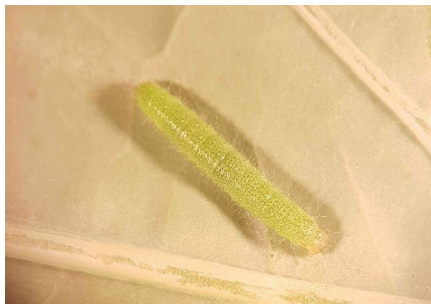
Photo 2: Le vol et les pontes de la piéride de la rave ( Pieris rapae ) sont toujours en cours. Lors du contrôle des cultures de ce lundi, on a encore trouvé un grand nombre de jeunes chenilles dans les champs.