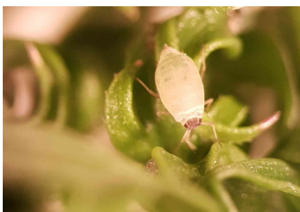
Photo 13: Sur les carottes, on peut aussi trouver actuellement le puceron de la carotte (ou du céleri) ( Semiaphis dauci ). Cette espèce n'est pas suspectée être vectrice du CtRLV.