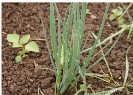
Photo 14: Jeunes oignons à bottelet présentant de fines traces de piqûres de nutrition de thrips.