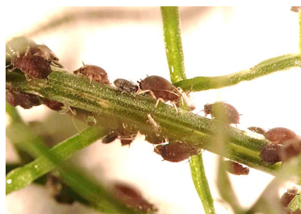
Photo 9: Les pucerons noirs de la fève ( Aphis fabae ) forment ponctuellement d'importantes colonies sur diverses cultures de plein champ, par exemple les fenouils, haricots nains, épinards ou bettes à côtes. Ces infestations entraînent des dégâts aux plantes.