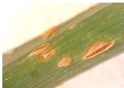
Photo 6: Le climat automnal est favorable aux diverses rouilles. Actuellement les liliacées présentent souvent les pustules orangées de la rouille de l'ail Puccinia allii . Ici, sur une feuille de ciboulette.