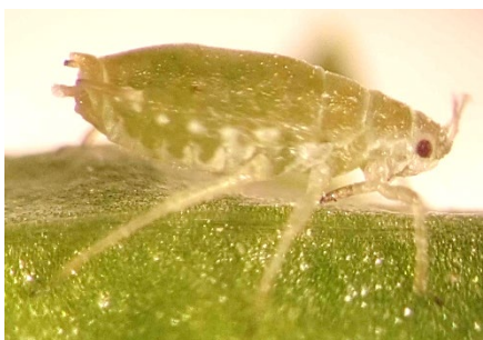
Photo 12: Puceron du saule avec ses deux cornicules typiques à l'arrière de l'abdomen.