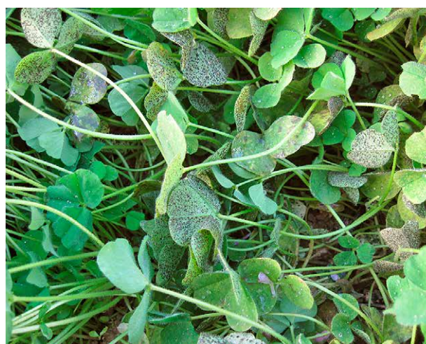
Figure 3 | Le trèfle incarnat est assez sensible à la maladie des taches de suie, particulièrement en arrière-été et en automne lorsque l'air est humide. En cas de forte infestation, les feuilles peuvent être toxiques pour le bétail.

test variétal avec le trèfle incarnat (Frick, 2013), elle a convaincu cette fois encore, surtout en ce qui concerne le rendement (1 re coupe et rendement total), l'aspect général et la vitesse d'installation. Les résultats montrent également qu'aucun des treize candidats n'a réussi à dépasser l'indice global de Contea (3,48), considéré