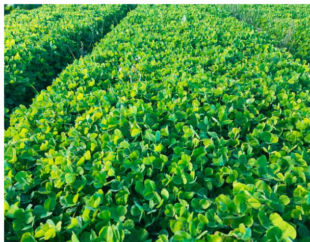
Figure 2 | Le trèfle incarnat en culture pure (densité de semis de 300 g/are) donne un couvert végétal dense. Il couvre rapidement le sol et supprime ainsi les adventives qui lèvent.

Le trèfle incarnat possède un bon potentiel de rendement, mais il est tout de même moins productif comparé aux trèfles d'Alexandrie ou de Perse. Un semis de printemps du trèfle incarnat n'est pas vraiment recommandé, car il ne donne qu'une floraison abondante, mais peu de fourrage. C'est pourquoi on utilise le trèfle incarnat principalement comme culture dérobée, après une culture de céréale. La période de semis idéale se situe entre mi-juillet et fin août. Un semis précoce peut donner une première récolte déjà en automne. La coupe principale est faite au printemps, début mai, lorsque le trèfle incarnat a atteint sa pleine floraison. Cette coupe plutôt tardive au printemps ne permet de mettre en place que du maïs à ensiler ou des pommes de terre.