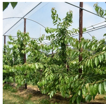
Fertile: ramification harmonieuse avec de belles branches horizontales.

Fertile est une cerise de table de bon rendement avec une très grande proportion de classe Premium. Elle convainc par son calibre intéressant, sa fermeté, sa couleur et sa saveur, mais également par sa croissance harmonieuse, sa belle ramification et sa vitalité.