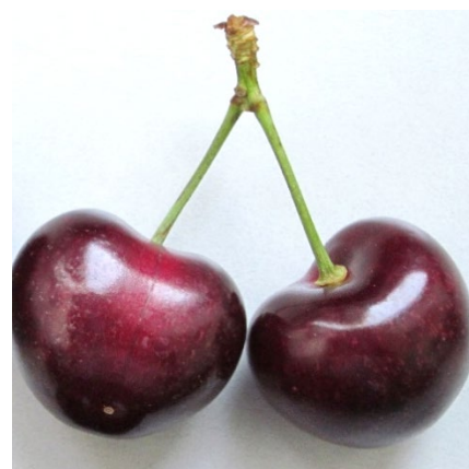
Fertile: cueillette facile malgré des pédoncules courts.