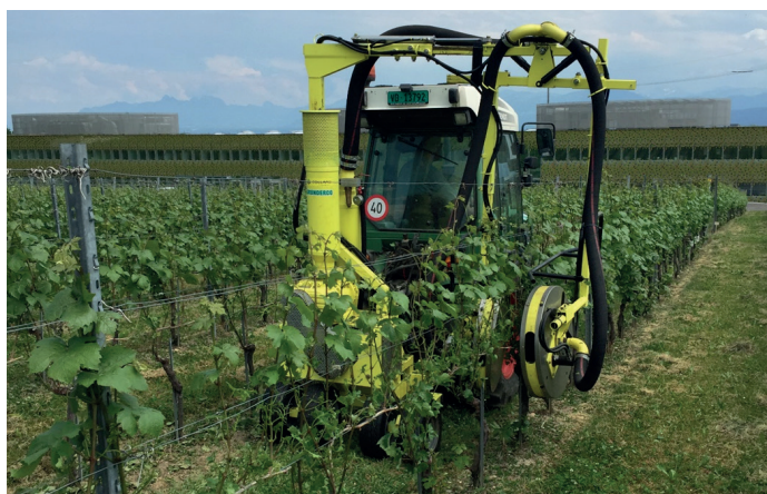
FIGURA 1. Asportatore di foglie a doppio flusso di aria a bassa pressione (Collard, Bouzy, Francia) in azione nella fase pre-fioritura (velocità 0,6 km/h). Vitigno Gamay, Nyon, Svizzera.

L'esperimento è stato condotto dal 2016 al 2020 nei vigneti sperimentali di Agroscope a Nyon, Svizzera (46°23'52.4"N 6°13'48.7"E) sui vitigni Doral e Gamay (piantati rispettivamente nel 2003 e nel 2007). Ciascun vitigno è stato sottoposto a tre trattamenti: 1) RF meccanica post-allegagione, 2) RF manuale pre-fioritura e 3) RF meccanica pre-fioritura. La RF manuale in prossimità del grappolo consisteva nel rimuovere manualmente dalla base di ogni tralcio le prime sei foglie, comprese quelle laterali. La RF meccanica dell'area equivalente consisteva nell'utilizzare un asportatore di foglie ad aria compressa montato su un trattore (E 3000 3P, 2003; Collard, Bouzy, Francia), con velocità diverse per i trattamenti pre-fioritura e post-allegagione. La velocità del trattore è stata inferiore per i trattamenti pre-fioritura (0,6 km/h) a causa della minore superficie fogliare in questa fase iniziale (fig. 1). Sono state effettuate misurazioni sul campo e analisi delle foglie e dei grappoli. Il diradamento dei grappoli è stato completato per ogni trattamento in una sola volta prima della chiusura dei grappoli per adeguarsi alle quote regionali e ottenere rese comparabili per ogni trattamento; i vini sono stati prodotti per ogni trattamento e poi degustati da un panel. Il materiale e i metodi completi sono pubblicati in OENO One 57(2) 3 .