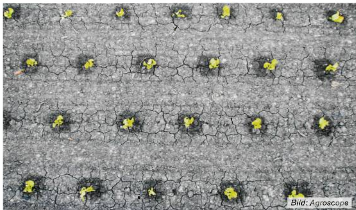
Mit dem Pflanzenschutzroboter behandelter Salat (erste Woche nach der Pflanzung).