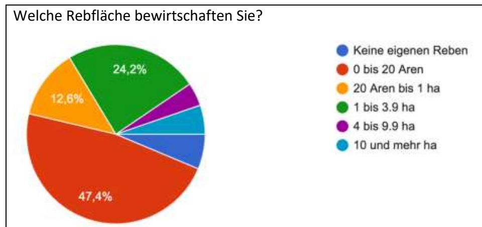
Welche Rebfläche bewirtschaften Sie?

Bei der diesjährigen Auswertung nahmen 95 Personen teil (2022: 94), der Anteil an Männern betrug schon wie in den Vorjahren 85 %. Ebenfalls ähnlich wie in den Vorjahren sind die Altersangaben: Rund ein Viertel sind jünger als 50, die meisten (46.3 %) zwischen 50 und 65 Jahre alt, 29.5 % sind pensioniert. Interessantes hat sich bei der Bewirtschaftung getan: Der Anteil an teilnehmenden Personen mit Kleinflächen bis 1 ha sank um rund 17 %, entsprechend nahmen Bewirtschafter mit grösseren Flächen zu.