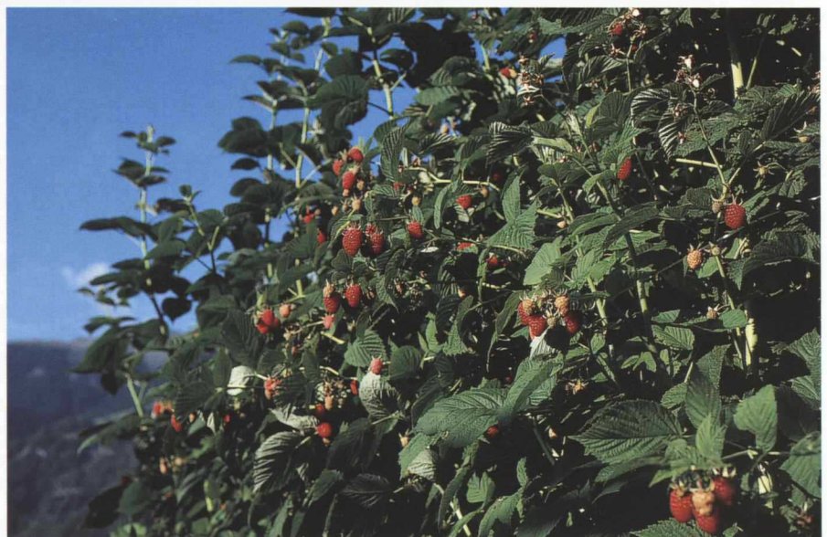
Fig. 1. Autumn Bliss, une variété de framboisier d'automne précoce et performante en zone de montagne avec de gros fruits rouge vif.

Les premières cultures de framboises d'automne, principalement de la variété Autumn Bliss, ont été plantées en Suisse il y a environ dix ans. Depuis, ces surfaces ont considérablement augmenté pour atteindre 76,5 ha en 2002, ce qui représente 51% des surfaces de framboisiers en Suisse (MARIÉTHOZ et RENGGLI, 2002). La particularité principale de ces variétés de framboisiers d'automne est de fructifier sur la partie supérieure des pousses annuelles. En effet, durant l'été, la partie supérieure des cannes émet des boutons floraux qui produiront des fruits, en plaine, de fin juillet aux premières gelées. Le principal avantage de cette culture est qu'elle permet d'approvisionner le marché de la mi-été jusqu'en automne et aussi de rationaliser la taille des arbustes. En effet, contrairement aux variétés d'été, la technique consiste à faucher les pousses de l'année au ras du sol après la période de végétation. Cette opération a l'avantage de pouvoir être mécanisée (faucheuse avec barre de coupe, débroussailleuse à lame, taille-haie, etc.). Dans le cas où les pousses annuelles sont gardées et passent l'hi-