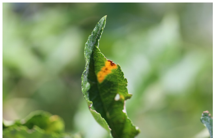
Abb. 8 a+b: Typische Saugschäden der Orientzikade am Blatt.