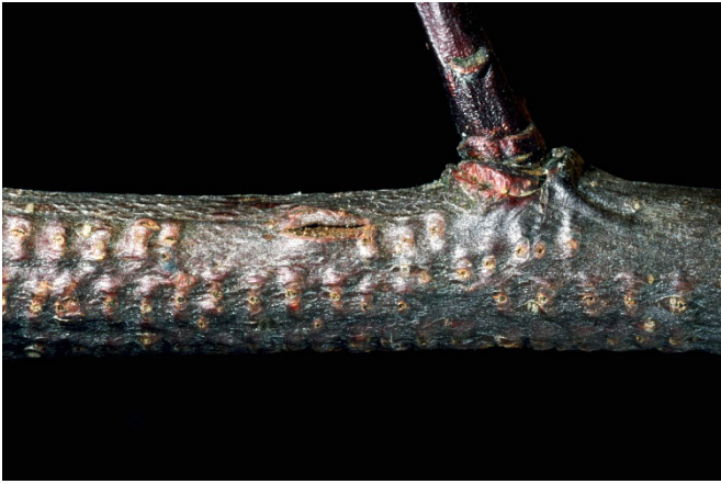
Abb. 10: Vernarbte Verletzungen am Apfelzweig durch Eiablage der Büffelzikade im Vorjahr.

Hagelverletzungen ähnlich (Abb. 10). Insbesondere bei jungen Bäumen und nach mehrjährigem Befall wird die Saftzirkulation eingeschränkt, was in der Folge die Bäume schwächt.