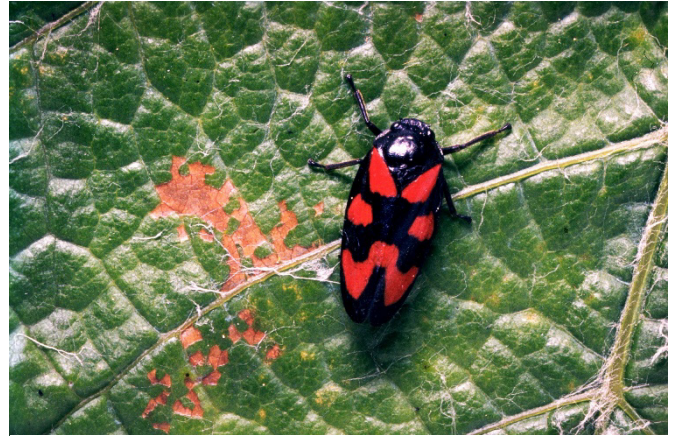
Abb. 11: Adulte Blutzikade mit typischem Schadbild auf Blatt.

Die Blutzikade saugt als Larve an Wurzeln von Gräsern. Sie überwintert im Nymphenstadium im Boden. Adulte sind von Ende April bis Anfang Juli anzutreffen. Sie sind nicht nur an Obstbäumen, sondern auch an Reben und anderen Pflanzen zu finden. Sie sind insbesondere bei warmen Temperaturen an Triebspitzen aktiv. Die Weibchen suchen im Juli Hohlräume im Boden auf, um die Eier dort in der Nähe von Graswurzeln abzulegen.