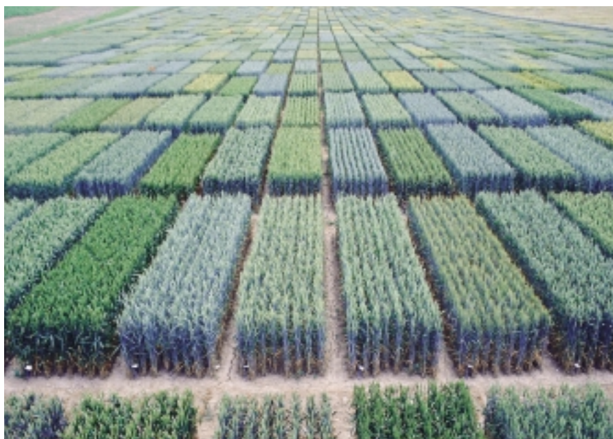
Essais variétaux de blé d'automne à Changins conduits par Agroscope.

Agroscope RAC Changins et FAL Reckenholz, en collaboration avec Delley Semences et Plantes (DSP), ont mis sur pied, en automne 2001, deux réseaux d'essais variétaux de blé, l'un conduit selon les exigences de l'agriculture biologique et l'autre répondant à celles du système de production extenso. Cette expérimentation en deux réseaux distincts a duré trois ans, comme prévu. Pendant cette période d'essais, les variétés de blé pouvaient obtenir la «valeur agronomique et technologique» (VAT) pour leur inscription au catalogue national suisse, dans l'un ou l'autre des deux réseaux. Dix lieux d'essais ont été conduits en conditions extenso et huit (respectivement neuf en 2004) en conditions biologique organique ou biologique dynamique. Les lieux d'essais n'étaient pas identiques pour les deux réseaux (fig.1). Cette expérimentation