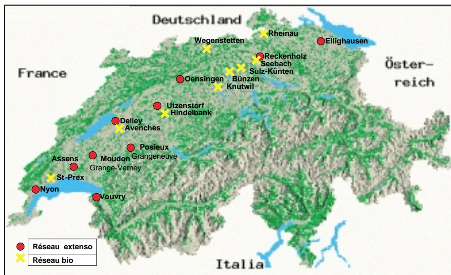
Fig 1. Carte de la Suisse avec les sites d'expérimentation des réseaux bio et extenso pour les variétés de blé d'automne (2002 à 2004).

avait pour but d'examiner la nécessité d'entretenir deux réseaux parallèles afin que les variétés sélectionnées pour l'agriculture biologique aient les mêmes chances d'être inscrites au catalogue national que les variétés classiques. Les différences de comportements agronomique et technologique des variétés ont donc été examinées en fonction du mode de culture. Cet article traite des aspects agronomiques des variétés, leur comportement technologique faisant l'objet d'une autre publication (Kleijer et Schwärzel, 2006). Bien que les mêmes variétés standard aient été cultivées dans les deux réseaux, les variétés de référence retenues pour l'évaluation des variétés candidates au catalogue national n'étaient pas identiques. En effet, l'agriculture biologique s'intéresse exclusivement aux variétés de très