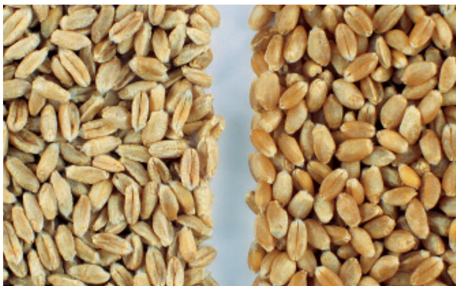
Les poids à l'hectolitre des cultivars utilisés dans cette étude variaient beaucoup, à gauche une variété avec 61,9 kg/hl, à droite 84,3 kg/hl.

Le PHL est influencé par plusieurs facteurs environnementaux, comme des températures durablement élevées pendant la phase de remplissage du grain, des précipitations avant la récolte et une pression de maladies élevée. Des facteurs génétiques font également varier le PHL, par le biais de la forme géométrique et de la relation longueur-