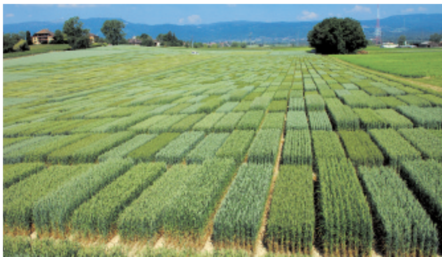
Les données utilisées dans cet article proviennent entre autres des essais de rendement du programme de sélection blé.

Les données sont issues des différents essais de rendement du programme suisse de sélection du blé d'automne et de printemps (Fossati et al. , 2003 et Brabant et al. , 2006). Chaque essai à trois répétitions était semé dans trois ou quatre lieux à travers la Suisse. En plus, les données des essais pour l'inscription au catalogue national suisse ont été utilisées. Ces essais ont été effectués dans huit (blé de printemps) à dix (blé d'automne) lieux avec trois répétitions. Les données des différents essais du programme de sélection et des essais d'homologation et années