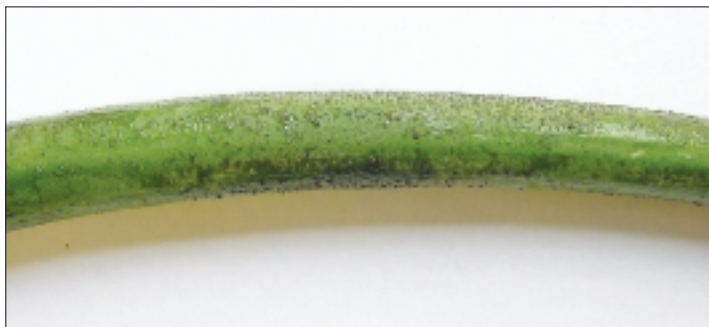
Fig. 2. Oignons montés et présentant des dégâts dus à Peronospora destructor .

La station agroscope FAW Wädenswil avait prévu pour 2004 d'étudier l'apparition et l'expansion du mildiou de l'oignon ( Peronospora destructor ). Les principales sources d'infection dans les cultures maraîchères en Suisse devraient être recensées, afin que la maladie puisse être mieux combattue. Le champignon en question dispose des possibilités suivantes d'hivernage: dans les semences, dans les bulbilles à repiquer, dans les oignons hivernant au champ, ainsi que dans les déchets de récolte non décomposés. La littérature professionnelle accorde beaucoup d'importance à l'hivernage du champignon sous forme de mycélium dans les bulbes d'oignons et dans les déchets d'oignons. Ce seraient ainsi principalement les cultures hivernées d'oignons infectés par le champignon Peronospora qui seraient responsables de la transmission de la maladie d'une année à l'autre. Les spores se trouvant sur les déchets de récolte et sur les semences seraient en conséquence d'importance mineure pour la transmission de la maladie. La première alerte concernant une attaque de mildiou est parvenue à la FAW déjà au début d'avril. On a constaté un cas isolé d'infection mas-