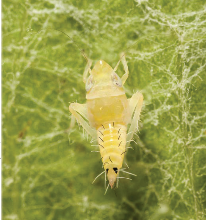
Fig. 1: Troisième stade nymphal (N3) de la cicadelle Scaphoideus titanus , principal vecteur de la flavescence dorée de la vigne.

S. titanus ont été évaluées par comptage visuel sur 4 × 100 feuilles par variante avant traitement, puis 6 à 7 jours après chaque traitement dans trois variantes: témoin non traité, atomiseur (2 applications de Pyrethrum FS® à 0,8 l/ha) et drone (2 applications de Pyrethrum FS® à 0,8 l/ha). Le premier traitement est intervenu à l'émergence des nymphes du troisième stade (N3) et a été répété 12 à 14 jours plus tard. Les modèles de drones DJI-Agras T30 et DJI-Agras T50 ont été utilisés respectivement en 2023 et 2024 et ont été comparés en 2025.