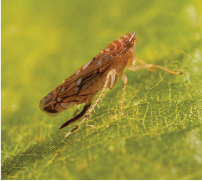
Adulte de la cicadelle Scaphoideus titanus .

Les traitements insecticides à l'aide de pyréthrinés naturels ne sont pas efficaces à ce stade.