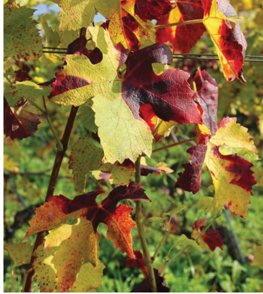
Symptômes de flavescence dorée sur Garanoir.

L'efficacité des pyréthrinés naturels appliquées au sol atteint généralement des valeurs supérieures à 70% sous réserve d'applications soignées réalisées sur des ceps préalablement épamprés et effeuillés (Linder et al. , 2023). En effet, cet insecticide de contact doit atteindre ses cibles pour assurer une