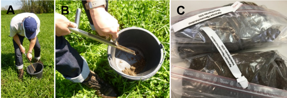
Abbildung 4: (A) Entnahme einer Bodenprobe mittels dem Bodenprobenstecher, (B) Abstreifen der Erdprobe in einen Mischbehälter und (C) gute Verpackung mit Gefrierbeutel mit Verschluss (Etikette aussen und doppelt verpackt).

Wichtig: Im Unterschied zur Probenahme bei den Kartoffelzystennematoden (KZN) werden hier, bei der Überwachung von M. enterolobii tiefere Einstiche (mind. 25 cm) gemacht. Deshalb wird dazu ein Probenstecher für tiefere Erdproben eingesetzt.