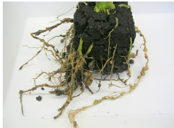
Abbildung 2. Der Schaden: Tomatenwurzeln mit so genannten Gallen, in denen sich die Larven entwickeln